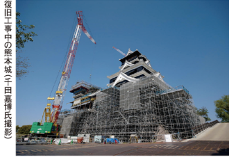
復旧工事中の熊本城

※掲載している内容は2019年8月現在の情報です。ツアー情報など、変更となる場合がございます。詳しくはお問い合わせください。