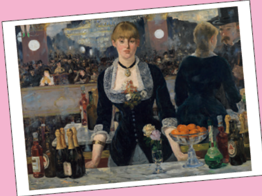
エドゥアール・マネ「フォーリー=ベルジェールのバー」