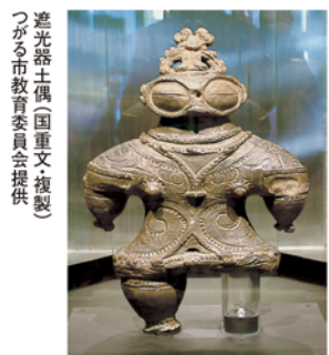
遮光器土偶(国重文複製)

天皇自ら議論を起こした生前退位が2019年4月、現実に。戦後を生きた天皇・皇后両陛下は日本と皇室に何をもちたのか。英語圏の近代天皇制研究第一人者による、ハーバード大学での白熱講義を1冊に。