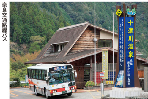
奈良交通路線バス

一路、新宮を目指し紀伊半島を縦断します。近年脚光を浴びた世界遺産の熊野古道や熊野本宮大社、玉置神社のほか、湯の峰や川湯といった温泉地など沿線には観光地も豊富。1日で乗り通すのもいいですが、寄り道しながら2、3日かけてゆっくりめぐると、のんびりとした旅の気分が味わえます。車内で出会った現地の人と触れ合うのも貴重な体験となることでしょう。交通至便で快適な旅をおすすめします。