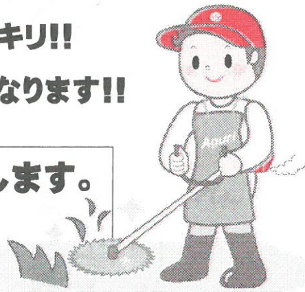
※イラストはイメージです。